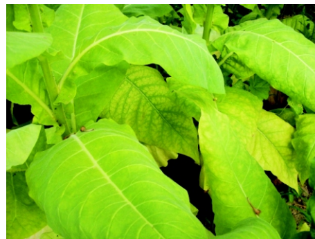
Tabak einjährig, großblättrich

Tabakpflanzen brauchen viel Licht und Wärme. Die Pflanzen vertragen keinen Frost. Tabak wächst am besten in handelsüblicher Blumenerde, bzw. lockeren, normalen Gartenboden.