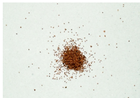
Tabaksamen sind sehr klein

Wenn die Pflänzchen 1 cm gross sind und 2 bis 4 Blätter haben, werden sie pikiert.